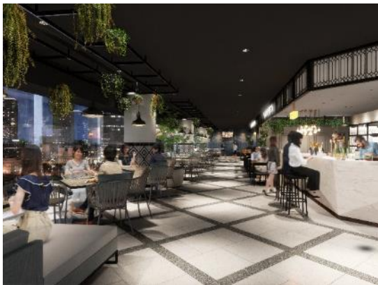
ウィンドウエリアのイメージ

「メインエントランスエリア」の床には大理石をあしらい、落ち着いた重厚感を創出すると共に、イベント時にはバーにもなるカウンターを設け、お客様をお出迎えする高揚感に満ちた空間へと改装いたします。壁面が全面ガラス張りの「ウィンドウエリア」では眺望の良さを更に楽しんで頂けるよう、グリーンで彩られたテラス空間をイメージし、半屋外で食事をしているような心地よさを感じることのできる内装といたしました。その他、隠れ家感を楽しんで頂ける「路地裏エリア」では、異国の雰囲気とライトの灯りが心地よく、つつい長居してしまうような空間を創出し、吹き抜けを挟み他エリアの賑わいから離れた「ウォールエリア」では、ソファ仕様椅子を配置し、ゆったりと過ごして頂ける空間へとリニューアルいたします。