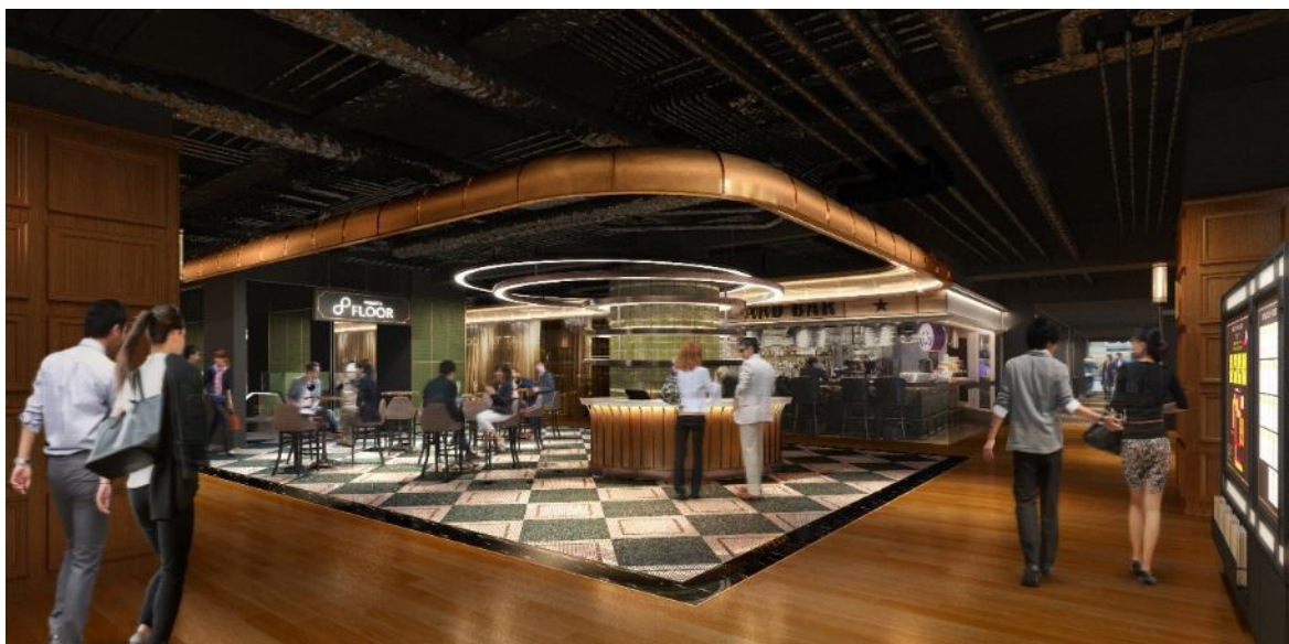
メインエントランスエリアのイメージ

「上質な大人の社交場（あそびば）」 ～遅くまで様々な楽しみ方でゆっくり過ごせる場所の再構築～